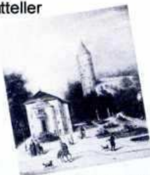
Altes Stadttheater und Weißer Turm