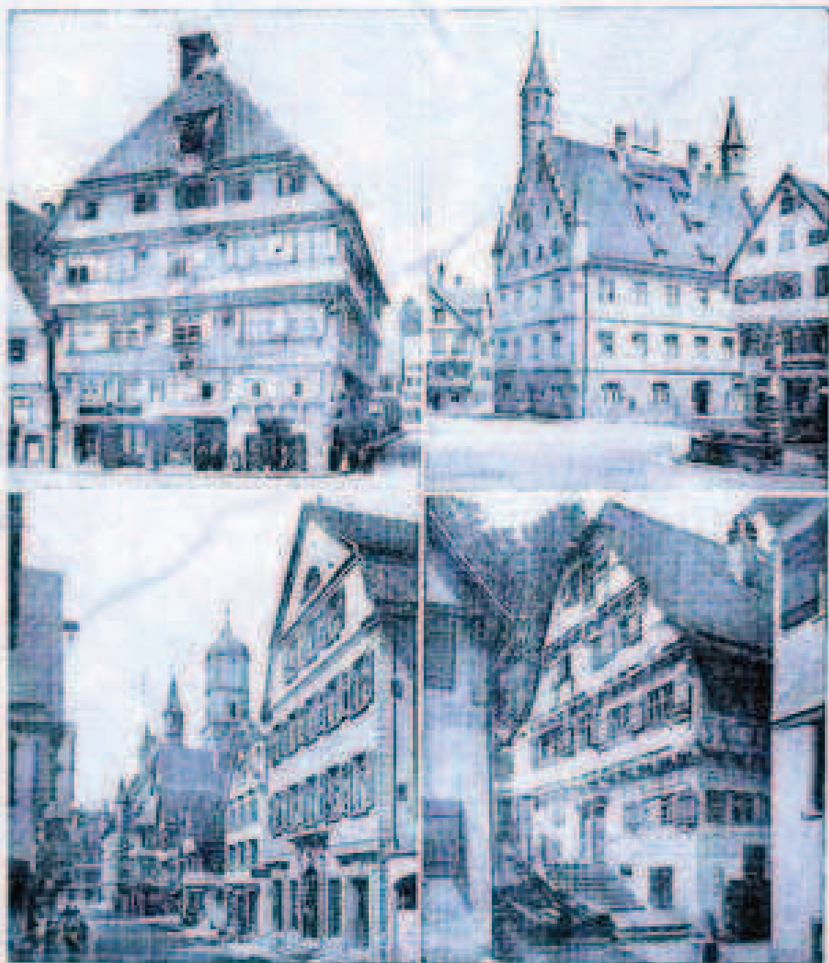
Haus „Hochhaus“, Rathaus, Kreuzstraße, Altes Haus am Weberberg.