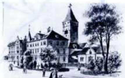
Das Ulmer Tor