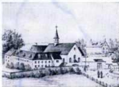
Kessgrütschiller mit Kirche, (altes Biberach), rechts die Löhnturm